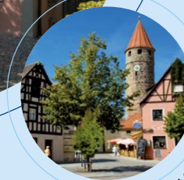
Färberturm mit Café